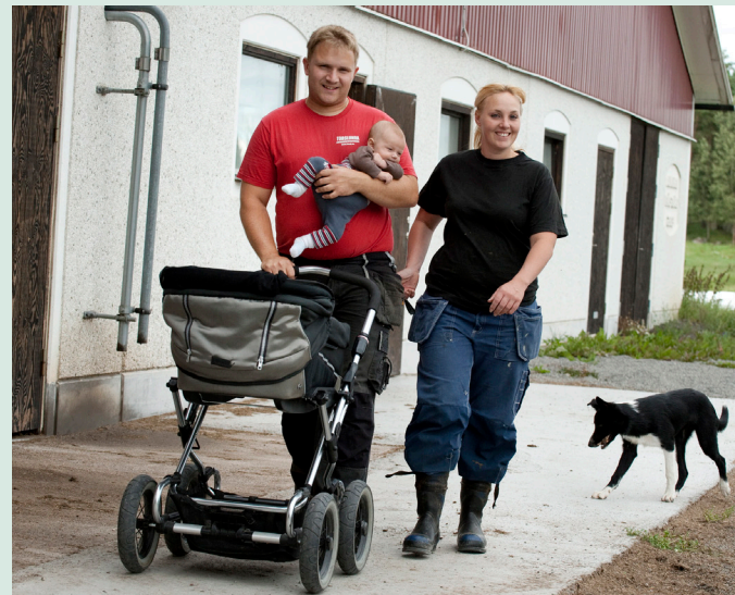
Det är viktigt att bjuda in alla företagare till mötet.

Tips för att synliggöra ojämställt bemötande!